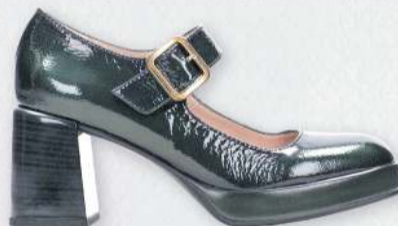
Hispanitas Tokyo 27.990 kr.