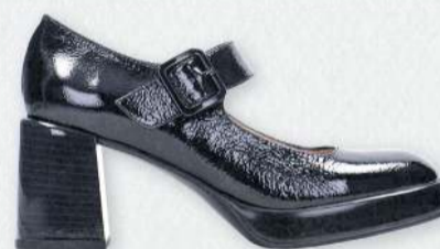
Hispanitas Tokyo 27.990 kr.