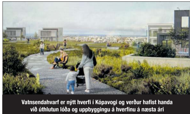
Vatnsendahvarf er nýtt hverfi í Kópavogi og verður hafist handa við úthlutun lóða og uppbyggingu á hverfinu á næsta ári

Umfangsmiklar framkvæmdir á vegum bæjarins eru áætlaðar á næsta ári fyrir rúmlega sex milljarða króna og áfram tryggt að innviðir mæti þörfum bæjarbúa. Lokið verður við uppbyggingu á Kársnesskóla og leikskóla tengdum skólanum. Þá verður hafist handa við byggingu nýs leik-