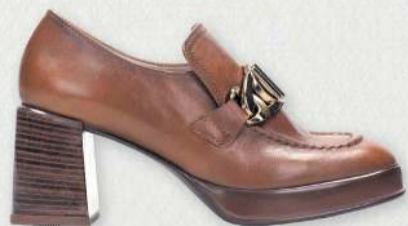
Hispanitas Tokyo 29.990 kr.