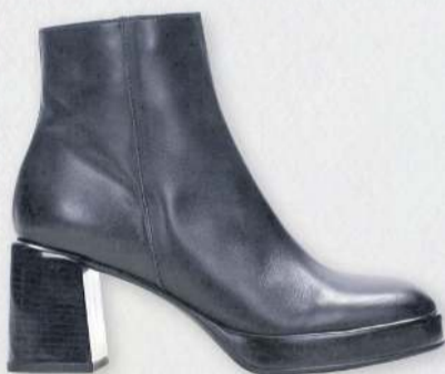
Hispanitas Tokyo 31.990 kr.