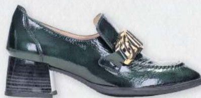
Hispanitas Charlize 27.990 kr.