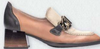
Hispanitas Charlize 28.990 kr.