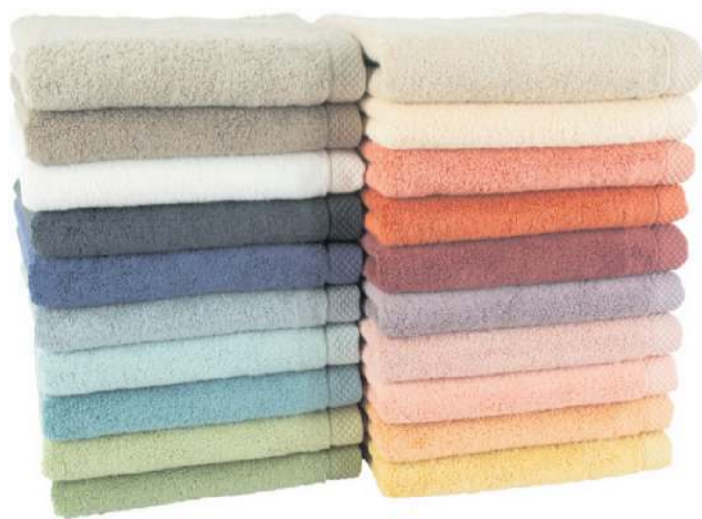
Hágæða Florence bómullarhandklæði og náttloppar frá CLARYSSE bath & kitchen