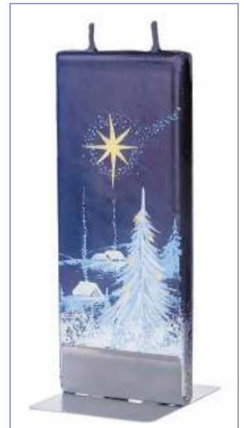
Falleg handmáluð jólakerti frá FLATYS