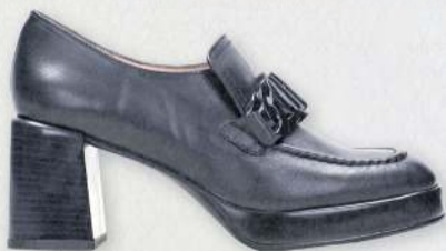
Hispanitas Tokyo 29.990 kr.