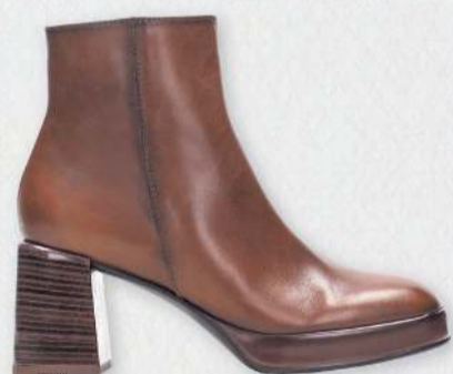
Hispanitas Tokyo 31.990 kr.