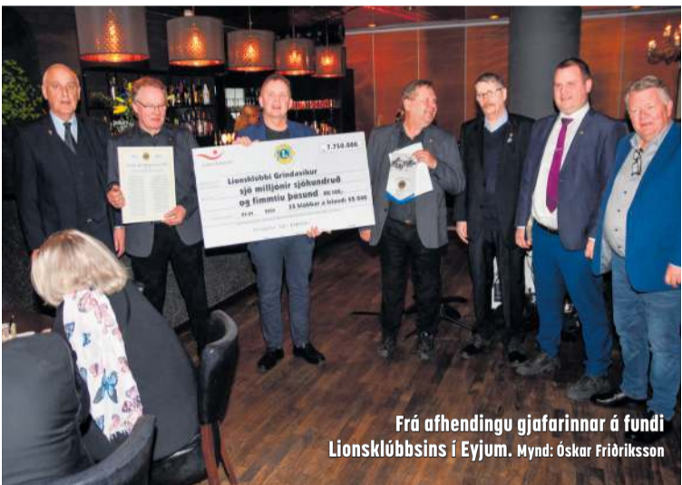
Frá afhendingu gjafarinnar á fundi Lionsklúbbsins í Eyjum.