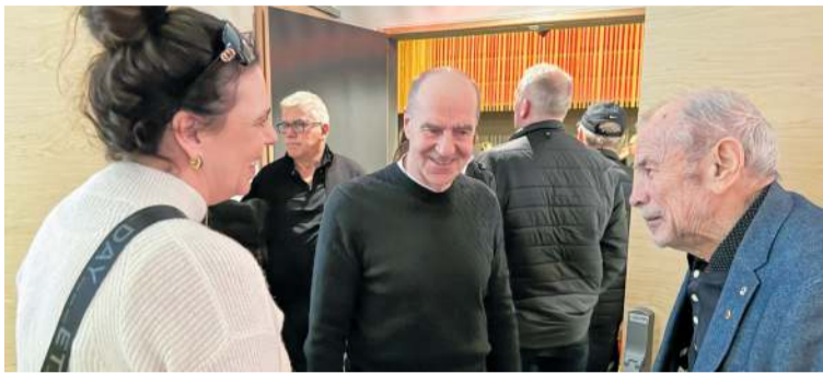
Gestir voru á öllum aldri og dagskráin fjölbreytt í Hljómahöll.