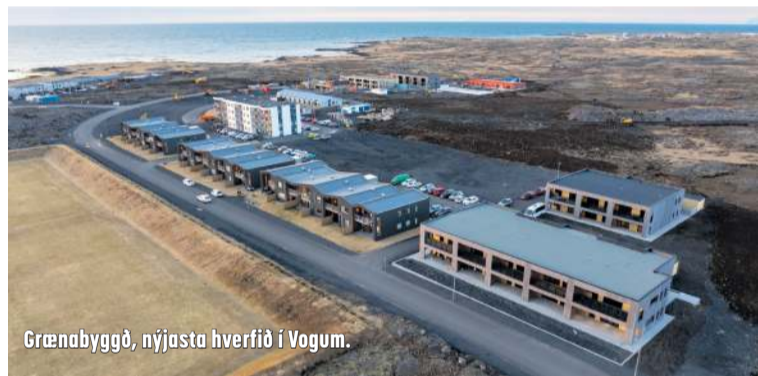
Grænabyggð, nýjasta hverfið í Vogum.

Í bókun bæjrráðs kallar það eftir skýrum og tafarlausum svörum frá ráðherra sveitarstjórnarmála um hvernig ríkissjóður hyggst styðja við sveitarfélagið og önnur sveitarfélög í sambærilegri stöðu, m.a. hvað snertir lausnir í húsnæðismálum leik- og grunnskóla, sem og að það tekjutap sem sveitarfélagið hefur orðið fyrir og horfir fram á vegna óvissu um fyrirkomulag lögheimilisskráningar þessa hóps verði bætt með viðunandi hætti.