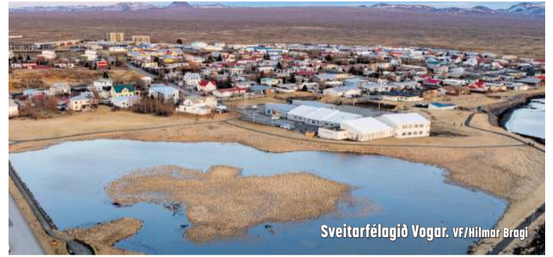
Sveitarfélagið Vogar.

Nú verða stjórnvöld einfaldlega að hrista sig aftur í gang og halda áfram með verkefnið, enda er því alls ekki lokið. Ég hef nefnt það við okkar æðstu ráðamenn og varað við því að ef það verði mikið meiri dráttur á því að stjórnvöld taki á þessum málum þá sé raunveruleg hættu á því að gjá myndist milli íbúa og ofan á allt annað geti íbúar Grindavíkur upplifað neikvæðni í sinn garð. Það væri ömurleg