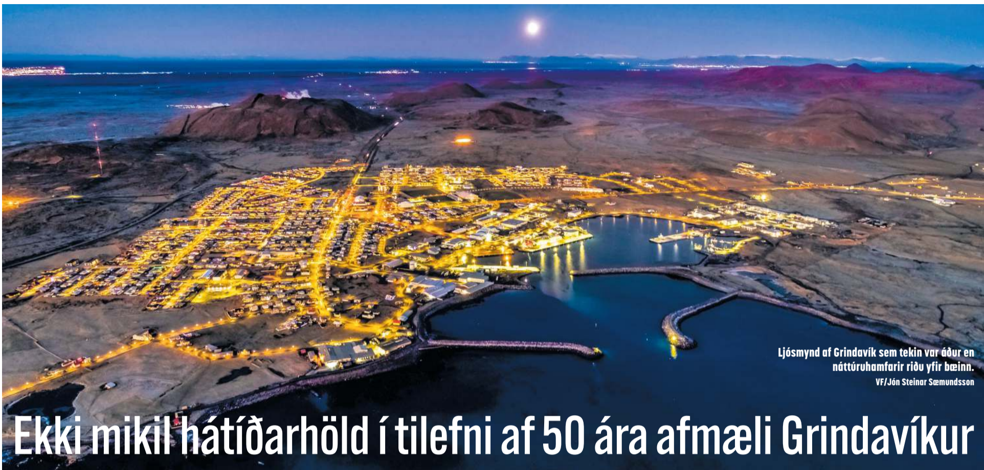
Ljósmynd af Grindavík sem tekin var áður en náttúruhamfarir riðu yfir bæinn.