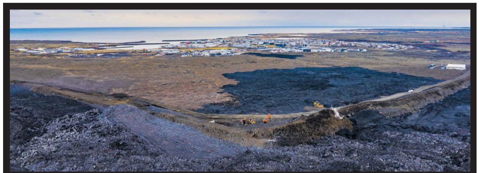
Unnið er að því að styrkja varnargarða norðan byggðarinnar í Grindavík þessa dagana.