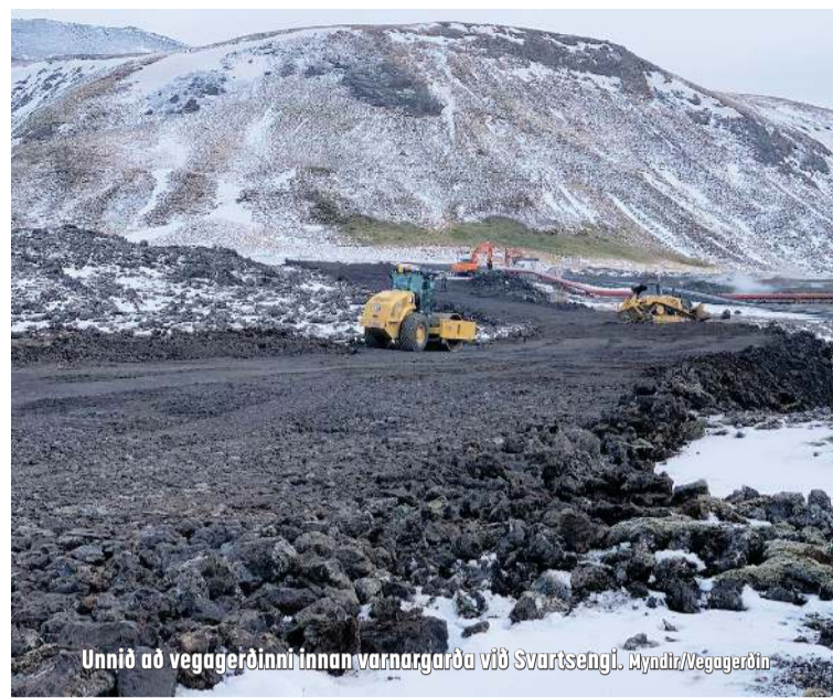
Unnið að vegagerðinni innan varnargarða við Svartsengi.