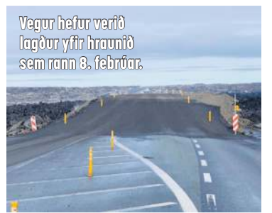
Vegur hefur verið lagður yfir hraunið sem rann 8. febrúar.