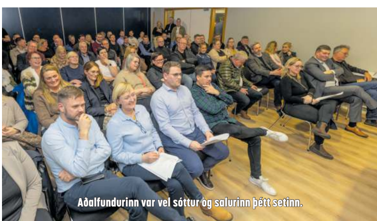
Aðalfundurinn var vel sóttur og salurinn þétt setinn.