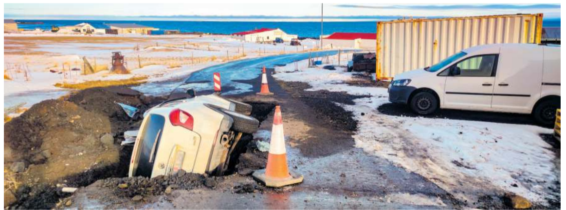
Frá vettvangi slyssins þegar bifreiðin endaði í lagnaskurði við Meidastaði í Garði.