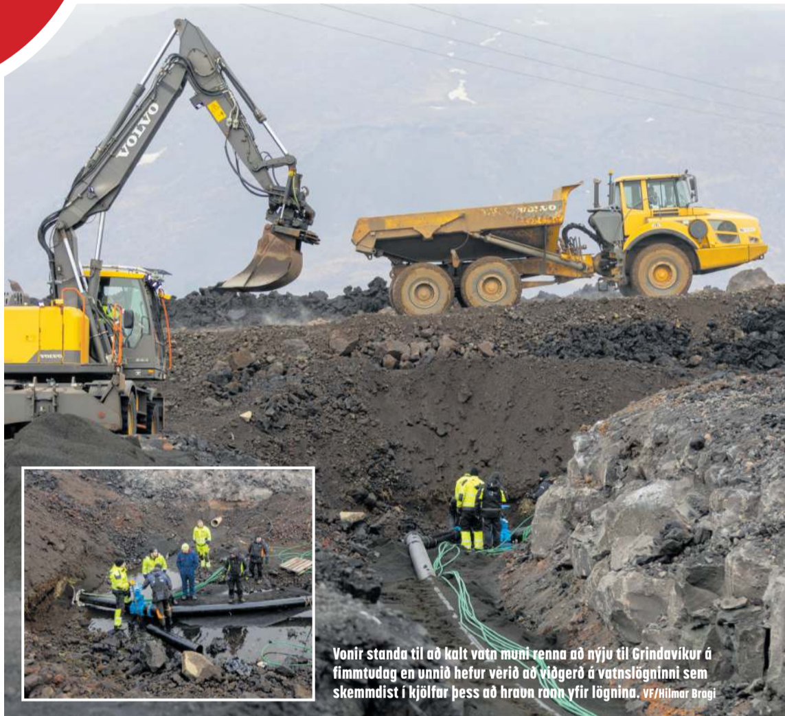
Vonir standa til að kalt vatn muni renna að nýju til Grindavíkur á fimmtudag en unnið hefur verið að viðgerð á vatnslögninni sem skemmdist í kjölfar þess að hraun rann yfir lögnina.