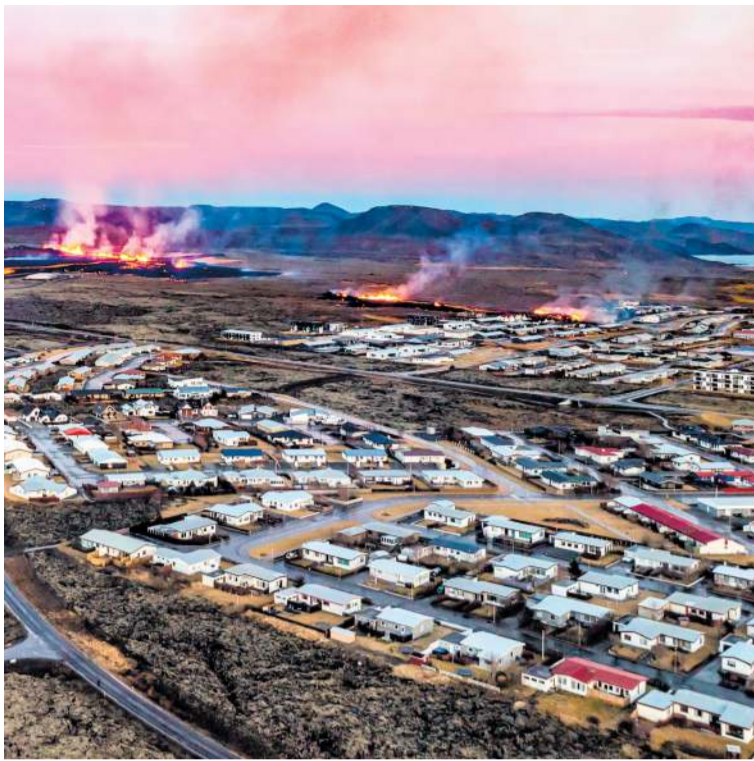
Frá eldgosinu við Grindavík 14. janúar 2024.