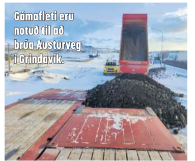
Gámafleti eru notuð til að brúa Austurveg í Grindavík.